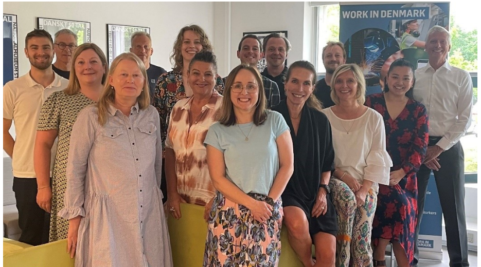
Workindenmark's hold af konsulenter

Workindenmark er en del af EURES – European Employment Services – som tæller mere end 1000 vejledere fordelt over hele